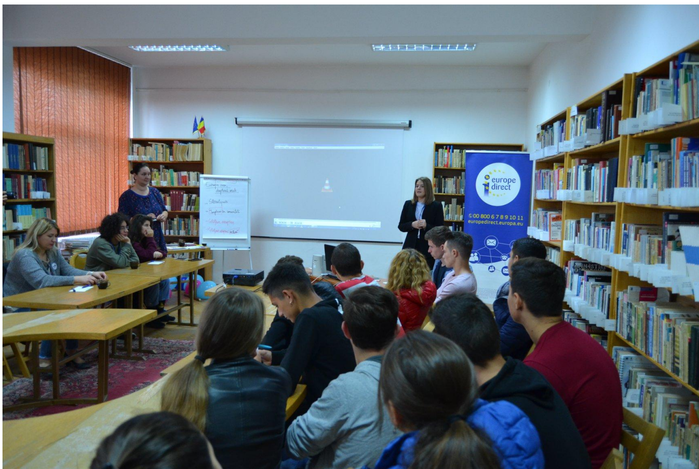
Ambasadorii Cetățeniei Europene de la Liceul Teoretic "Miron Costin" din Pașcani, în vizită la colegii lor de la Colegiul Tehnic "Dimitrie Leonida" din Iași